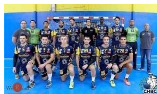
Le Compiègne Handball Club (N2) remporte le Picantin de la meilleure équipe de l'agglomération