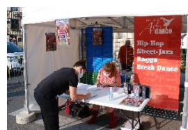
L'association participe chaque année au forum des sports