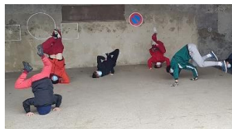
Actuellement, les cours sont organisés en visio ou en extérieur