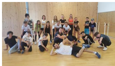
Les ados sont nombreux au sein d'As en dance.