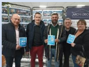
JANVIER 2023 US Choisy-au-Bac