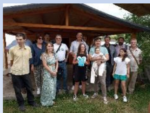
MAI 2023 ASCC Margny basket