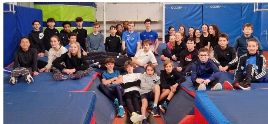
Durant deux jours, les jeunes athlètes de la VGA COMPIÈGNE étaient réunis au stade Paul-Petitpoisson pour parfaire leur technique.