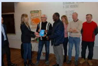
FEVRIER 2023 Les Archers de Compiègne