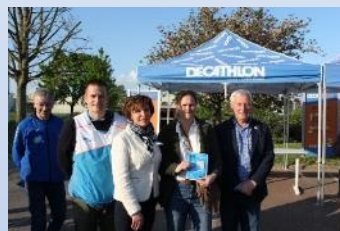
MARS 2023 Jeunesse et natation Compiègne 60