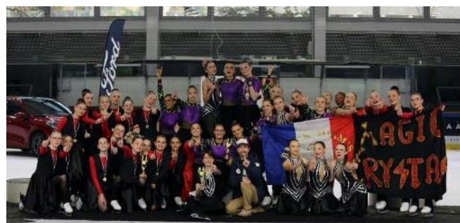
Les trois équipes du SKATING CLUB COMPIÈGNE OISE se sont imposées lors de la deuxième manche des championnats de France de patinage synchronisé à Caen.