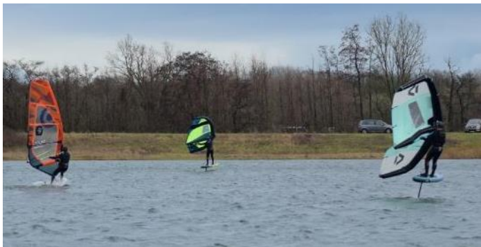
Des licenciés de PLANCHE OISE PASSION ont profité de la tempête Louis pour s'en donner à cœur joie sur le plan d'eau du petit patis.