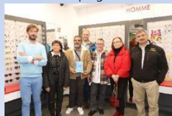
SEPTEMBRE 2023 Judo jujitsu Venette