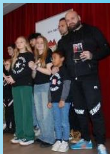
Equipe (réception à Saintines), Kick and Thaï Saintines. Parrain : Super U Thourotte