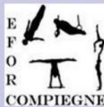
Entente familiale Omnisport Royallieu Compiègne