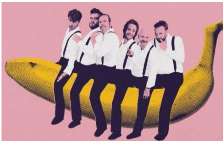
C'est un spectacle haut en couleurs qui sera proposé à Jonquières

Les invitations gratuites sont à retirer auprès de l'OSARC : 06 52 94 92 82 ; contact@offisport.com