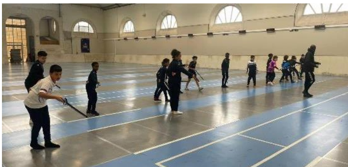
Escrime, escalade, et bien sûr du foot. C'était le programme du stage multisports organisé par l' AFC COMPIÈGNE .