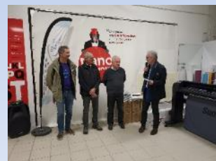
OCTOBRE 2023 Para sport compiégnois