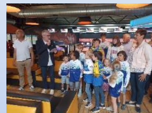
AVRIL 2023 BMX Compiègne-Venette