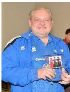
Exploit (réception à Margny-lès-Compiègne), Berneuil-Compiègne-La Croix-Venette-Margny Oise TT. Parrain : Fleur & Sens