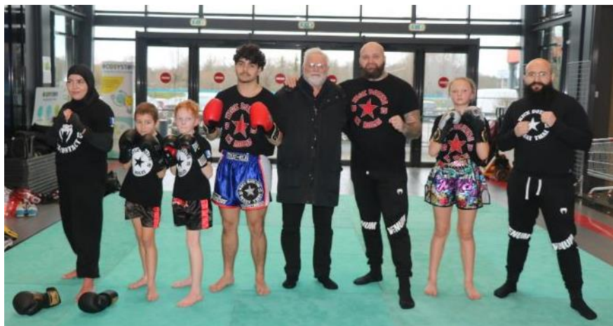
La journée a débuté avec une démonstration du Kick and thaï Saintines.