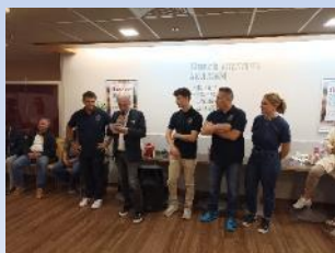
ÉTÉ (juin, juillet, août 2023) Tennis club La Croix