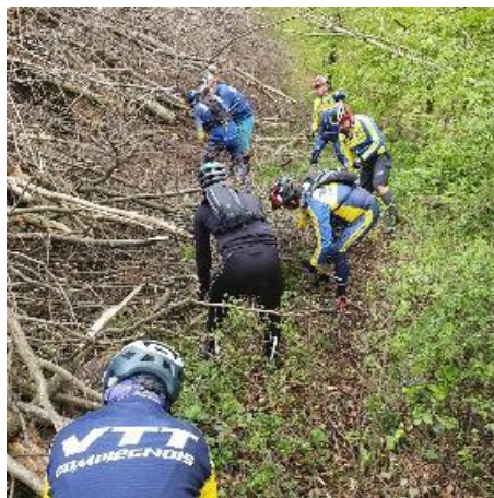
Le VTT COMPIEGNOIS prépare le Raid impérial (dimanche 16 juin) en nettoyant des chemins forestiers.