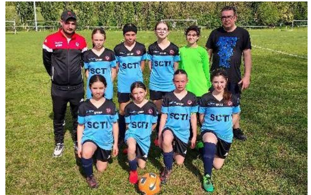
Les U13 féminines de l' AMICALE SPORTIVE SAINT-SAUVEUR progressent, elles ont participé à la finale départementale du Challenge Pitch.