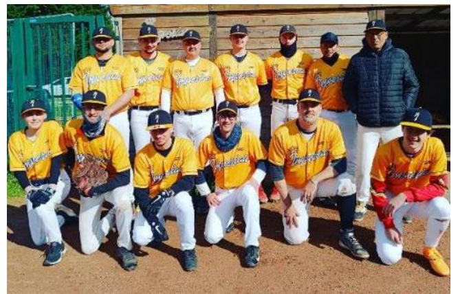
La saison estivale a bien débuté pour les IMPÉRIALS DE COMPIÈGNE qui ont remporté trois de leurs quatre premières rencontres en baseball.