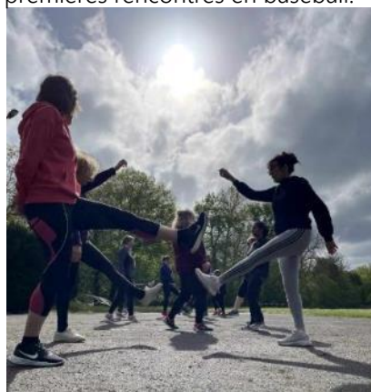
Une séance sport santé gratuite, ouverte à tous, a été mise en place par COMPIEGNE TRIATHLON . Une belle initiative.