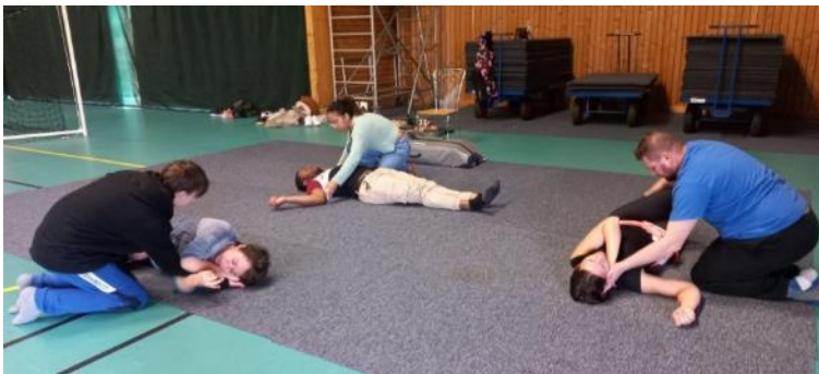
Le BADMINTON MARGNY-VENETTE a organisé une formation aux gestes de premiers secours.

"Au cœur des clubs" est une rubrique phare de l'OSARC Mag'. Chaque mois elle prend un peu plus d'épaisseur et c'est tant mieux, puisqu'elle traduit la riche activité sportive qui anime l'agglomération. Chaque club des 22 communes de l'agglomération, toutes adhérentes à l'OSARC, y trouvera sa place. Alors, si vous n'y figurez pas encore, parlez-nous de vous ! Comment faire ? C'est simple, adressez-nous par e-mail ( contact@offisport.com ) vos images, sportives ou festives, avec vos jeunes et moins jeunes, selon vos choix que nous respecterons en vous publiant. Pour en savoir plus, contactez directement Sylvie ou Walter au bureau de l'OSARC (06 52 94 92 82).