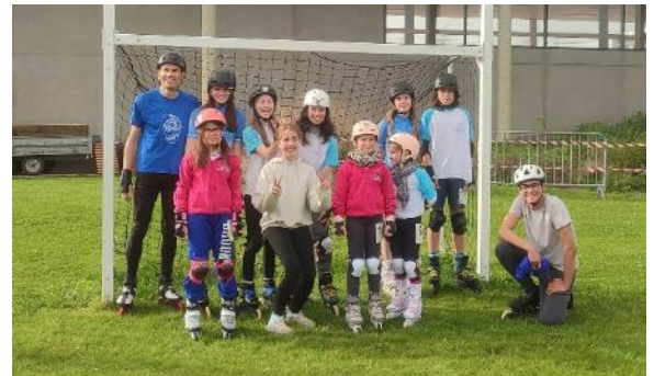
Lors du challenge interclubs départemental, le ROLLER CLUB DE COMPIEGNE a brillé en montant à cinq reprises sur le podium.

L'équipe féminine de rugby à X du RUGBY CLUB COMPIEGNOIS est devenue championne des Hauts-de-France, en s'imposant 34-29 contre Grande-Synthe.