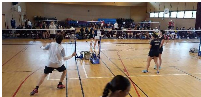
Comme chaque année, c'est à l'espace Dagobert de Verberie que le BETHISY BADMINTON CLUB a organisé le tournoi Dagobert. Une manifestation qui a réuni plus de cent badistes