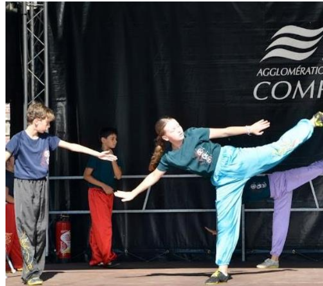
Chaque année, le Forum des sports est rythmé par de nombreuses initiations et démonstrations.